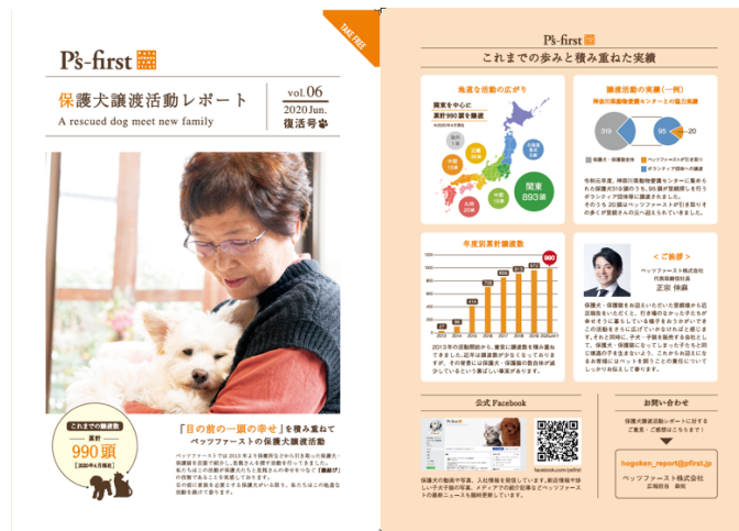
[写真]保護犬譲渡活動レポート Vol.6

コンテンツにしております。また、Facebook や Instagram を通じて保護犬たちの性格や特徴、お店に来る前の様子も紹介しており、活動自体の透明性の担保にも努めております。