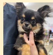
異所性尿管疑いで手術した ロングコートチワワ

現在は東京ウェルネス管理センターで療養中です。元気になり、幸せに暮らせるよう今後もサポートしていきます。