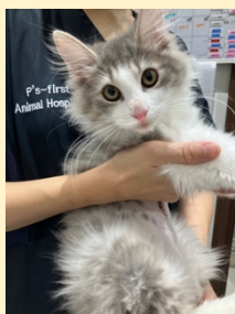
▲術後回復した ノルウェージャン・フォレスト・キャット

店舗で体調チェック中に急に泣き喚めく異変が見られたため、当院を受診。レントゲンにて心陰影の拡大、超音波にて心嚢内に肝臓を確認し、横隔膜心嚢ヘルニアと診断。当院で、心嚢内に脱出していた肝臓の癒着剥離後腹腔内に戻し、圧迫されていた肺を含気させて横隔膜を閉鎖する手術を実施。押しつぶされていた肺がふくらみ活発さが出てきたが、術後に軽度の漏斗胸が認められたため、呼吸状態に気を付けて様子を見ていく必要があり、ウェルネス管理センターで経過観察中。